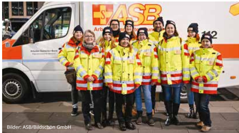
Das Kältehilfe-Team der Kölner Bundesgeschäftsstelle mit ASB-Präsidentin Katarina Barley (3. v. r.).